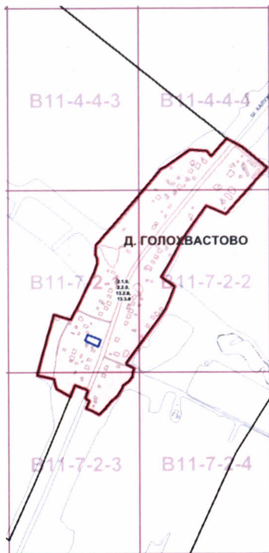
Схема границ подготовки проекта внесения изменений в правила землепользования и застройки города Москвы в отношении территории по адресу: город Москва, поселение Вороновское, д. Голохвастово, (кад. № 50:27:0030128:136), ТАО